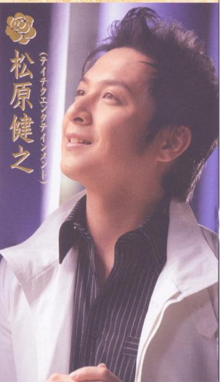
松原健之 (テイチクエンタテインメント)